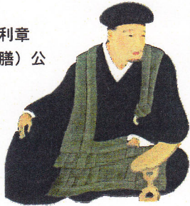
栗山利章 (大膳) 公

二代目藩主・黒田忠之の我がままな乱行が、幕府の知るところとなり、藩取り潰しの危機に至る。筆頭家老・栗山大膳(善助公嫡男)は、身を賭して『わが藩主に謀反の疑いあり』と徳川家光に訴え出る。そこには藩を守るための深い深い知略があった。