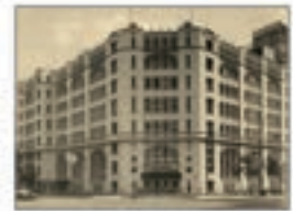
旧肥後橋本社ビル (設計:W・M・ヴォーリス)