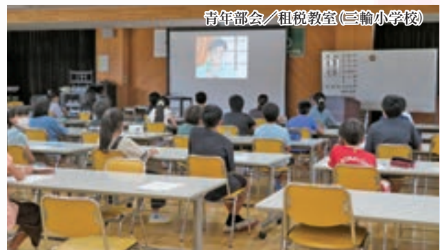
青年部会／租税教室(三輪小学校)