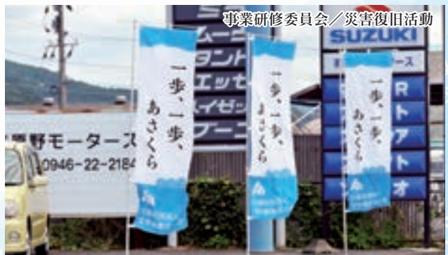
事業研修委員会／災害復旧活動