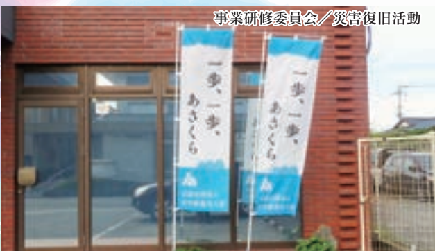
事業研修委員会／災害復旧活動