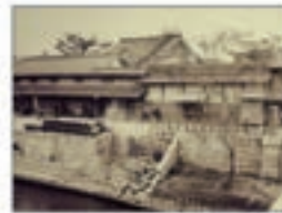
大同生命の礎を築いた 大坂の豪商“加島屋”