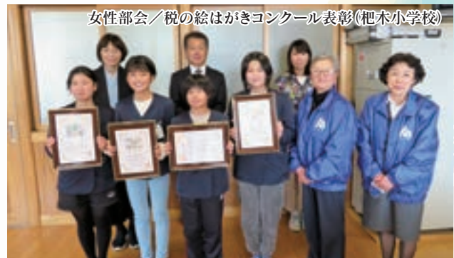
女性部会／税の絵はがきコンクール表彰(杷木小学校)