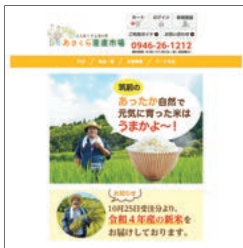
▲あさくら産直市場ECサイト

年から取り組み始めた「あさくら産直市場」を2022年9月に事業化しました。私たちは、この気持ちを絶やさず、真剣に向き合います。これからも、どうぞ株式会社四ヶ所をよろしくお願いいたします。