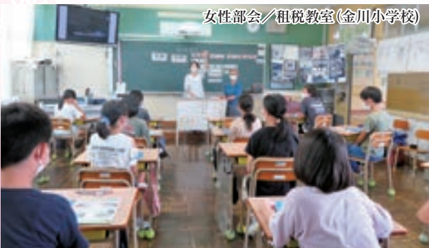
女性部会／租税教室(金川小学校)