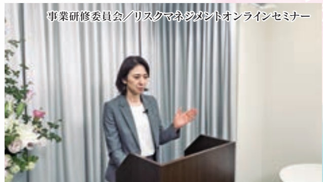
事業研修委員会／リスクマネジメントオンラインセミナー