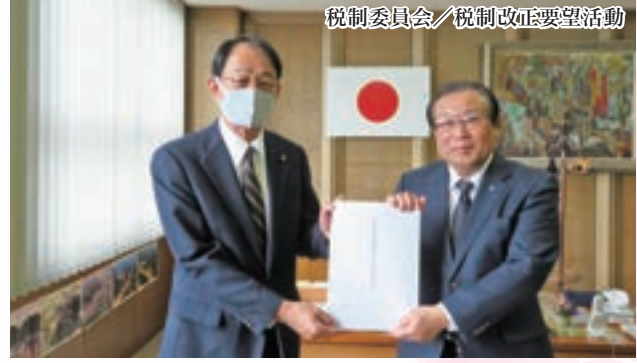
税制委員会／税制改正要望活動