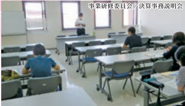
事業研修委員会／決算事務説明会