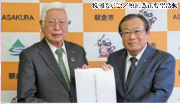
税制委員会／税制改正要望活動