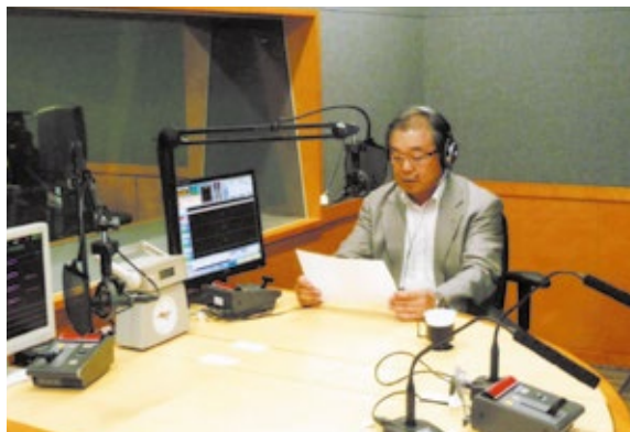
FM FUKUOKA スタジオで収録中の森山さん