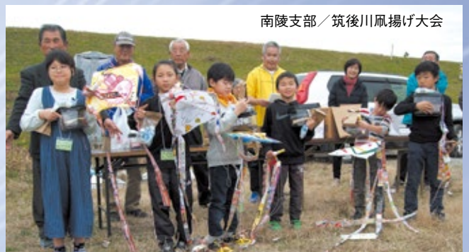
南陵支部／筑後川風揚げ大会