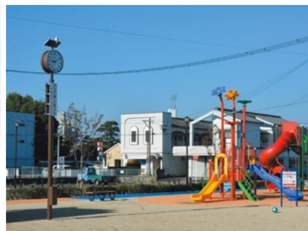
甘木中央公園 時計の贈呈

法人会が公益社団法人に移行して5年目を迎えたことが、朝倉市の都市計画事業で整備中だった甘木中央公園に時計を贈呈しました。