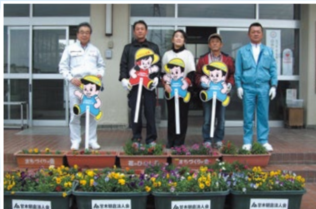
蜷城小学校 プランターと飛び出し人形の贈呈

九州北部豪雨の被災地では、多くの人形が流されました。今後、小学校の協力を得ながら復旧整備されたところから随時設置していくことにしています。あわせて、管内全地域での信号機のない危険交差点などへの追加設置、破損等に伴う交換など毎年補充を行う予定です。