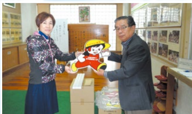
東小田小学校 飛び出し人形の贈呈