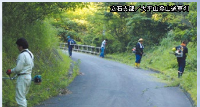
立石支部／大平山登山道草刈