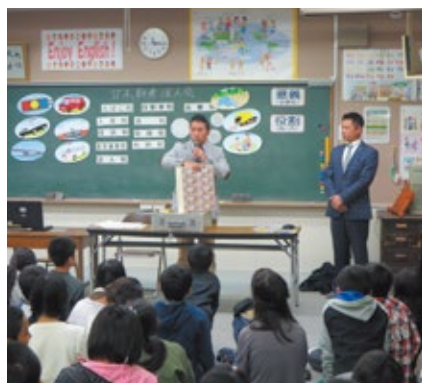
租税教室(甘木小学校)