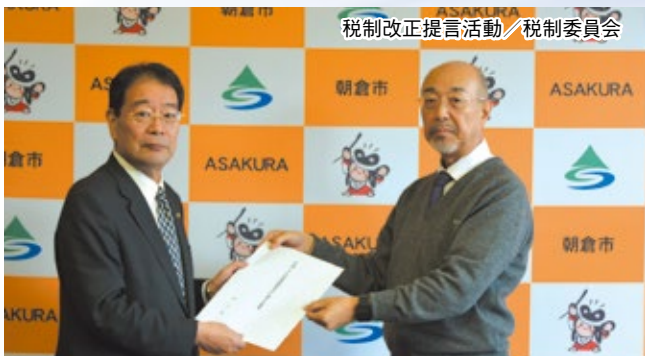
税制改正提言活動／税制委員会