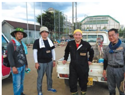
災害ボランティア活動