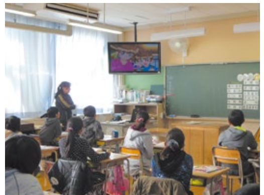
租税教室(朝倉東小学校)