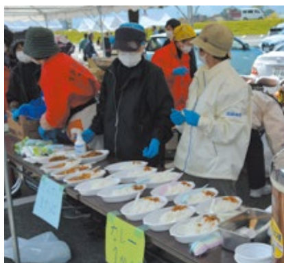
災害復旧復興支援イベント