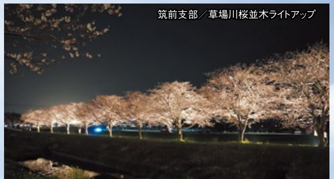
筑前支部／草場川桜並木ライトアップ