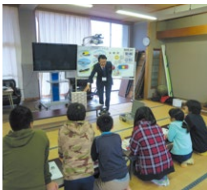
租税教室(志波小学校)