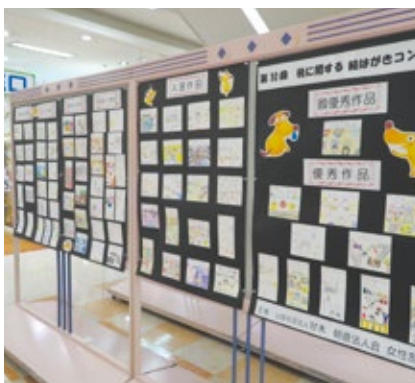
絵がきコンクール展示風景