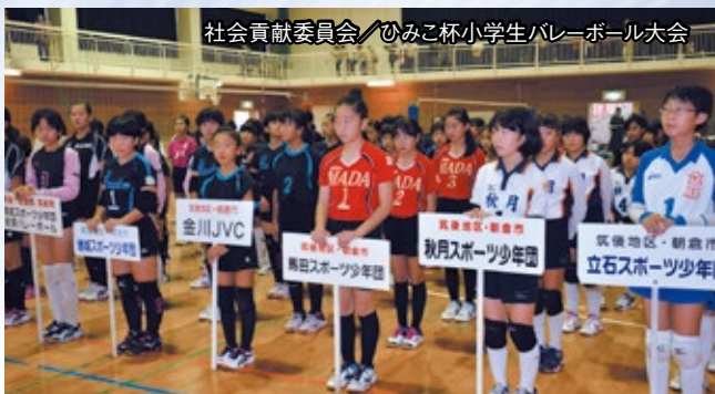
社会貢献委員会／ひみこ杯小学生バレーボール大会