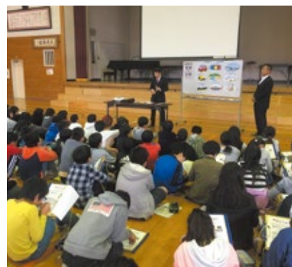
租税教室(立石小学校)