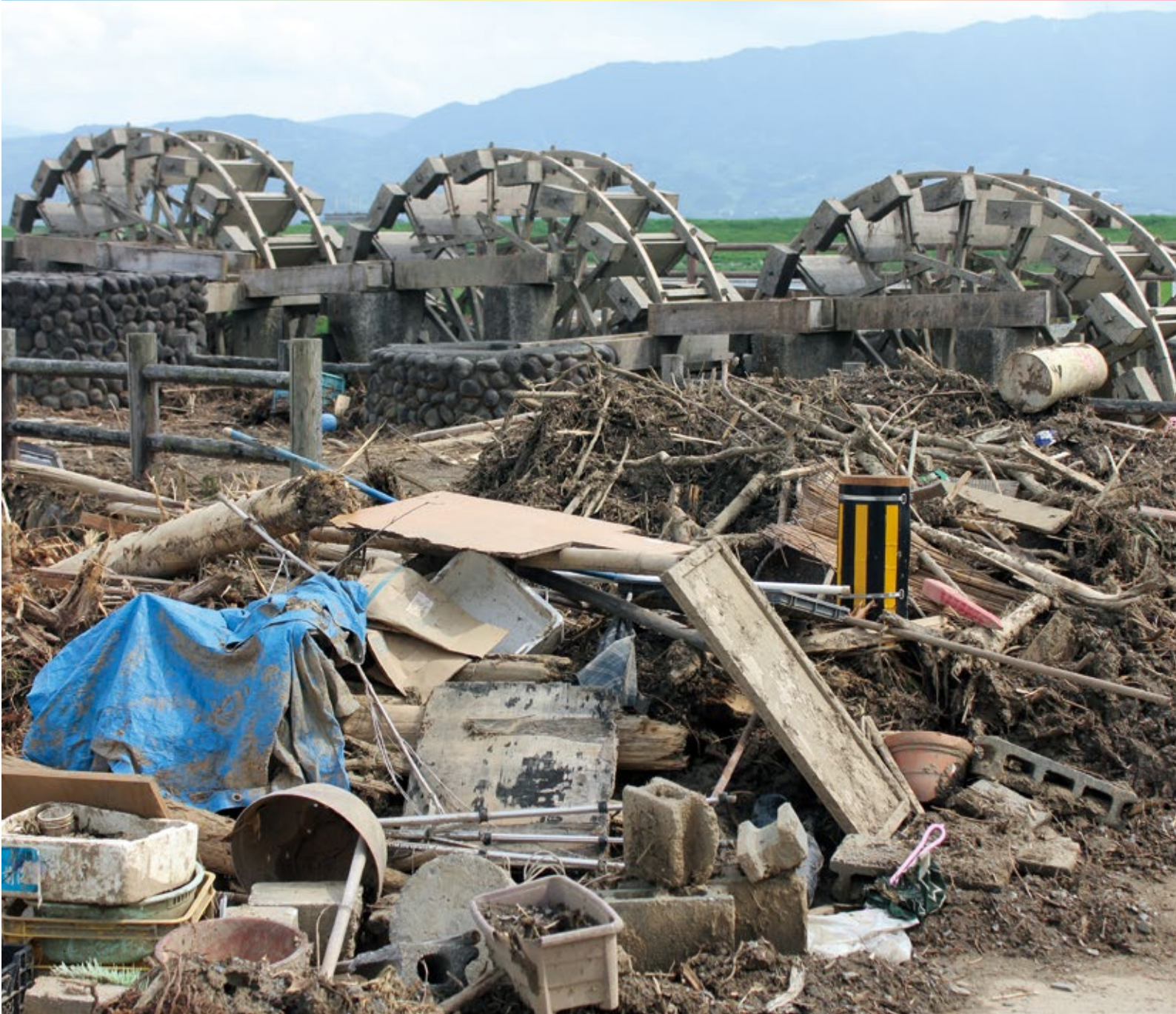
三連水車被災風景