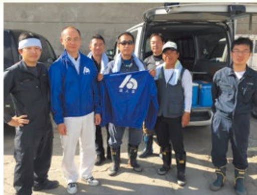
災害ボランティア活動