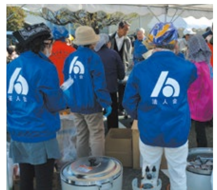
災害復旧復興支援イベント