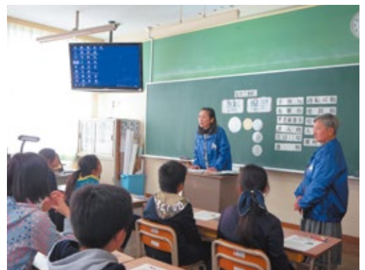
租税教室(金川小学校)