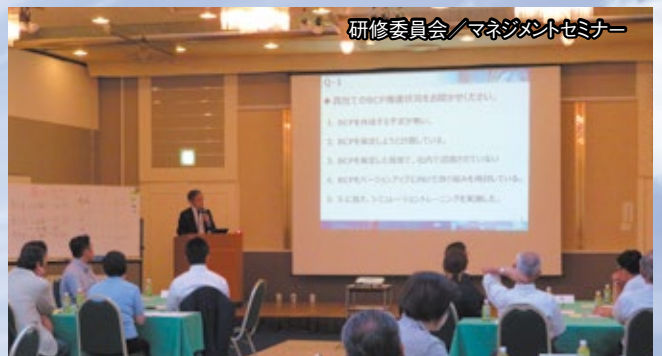
研修委員会／マネジメントセミナー