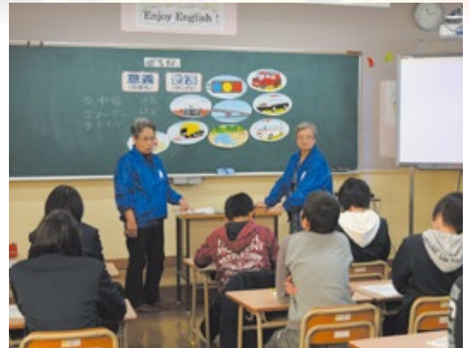
租税教室(蛸城小学校)

ある方が言われた「自分が楽しいと思うことで人を呼べる」という事、その言葉が心に残っています。