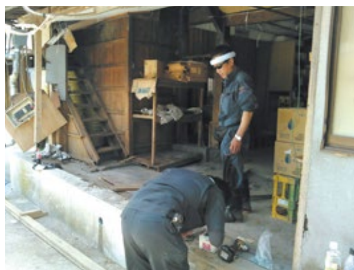
災害ボランティア活動