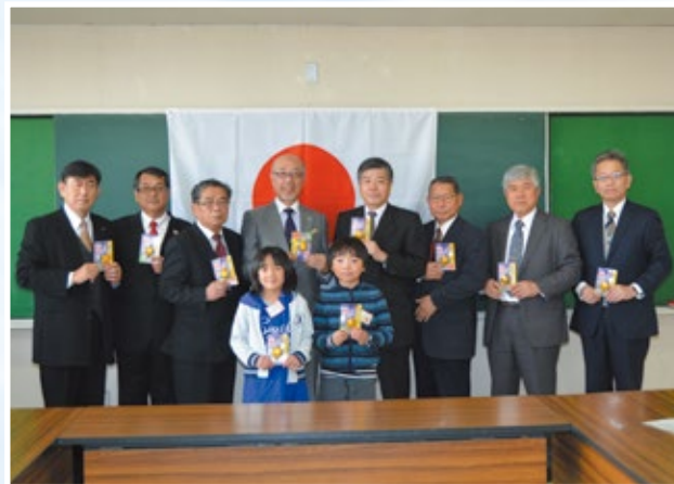
防犯ブザーを子どもたちへ贈呈

子どもたちに対する犯罪防止のために少しでも役立つことを願って、今後もこの活動を継続していきます。